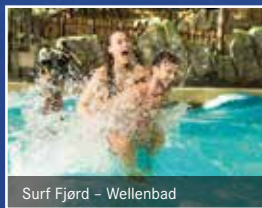
Surf Fjord – Wellenbad