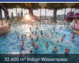
32.600 m 2 Indoor-Wasserspass

Ganzjährig geöffnet Tages- & Abendtickets verfügbar