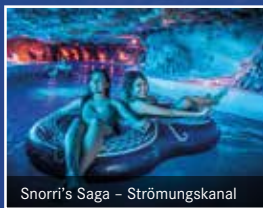
Snorri's Saga – Strömungskanal